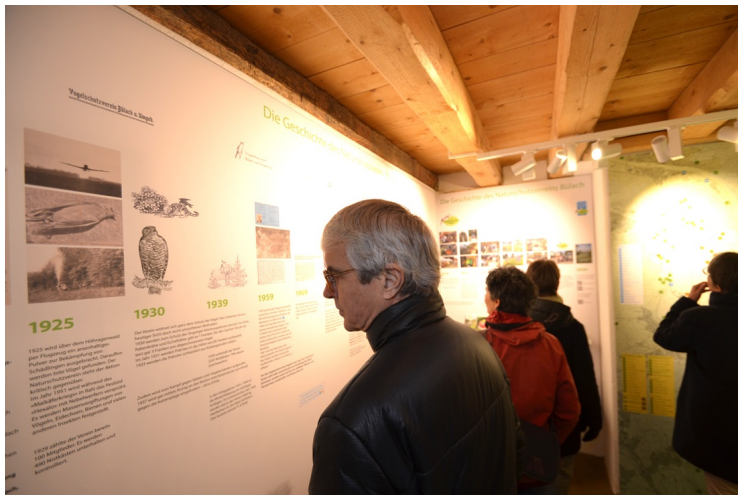
Informationen nach Jahren geordnet über den Naturschutzverein.