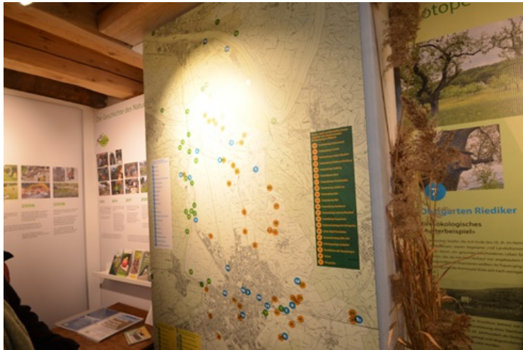
Eine Karte mit der Aufzählung der Arbeiten des Naturschutzvereins.

anderen Gemeinden, ursprünglich ebenfalls im damals vogelschutzverein genannten Verein dabei. Kissling brachte einige Informationen aus der Geschichte des Vereins und sprach auch kurz über den Wandel vom Vogel- zum Naturschutz.