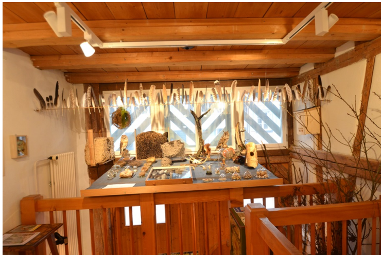
Zeugen der lokalen Vögel und Tiere.

Das Bülacher Ortsmuseum, an der Brunnigasse 1, ist jeweils samstags und sonntags von 10-12 Uhr geöffnet.